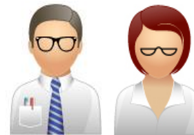
Líderes Grupos de Investigación