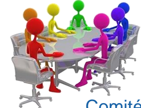
Comité de Investigaciones