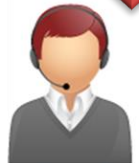
Coordinación de Investigaciones

Ficha de Inscripción de Tema Proyecto de Grado