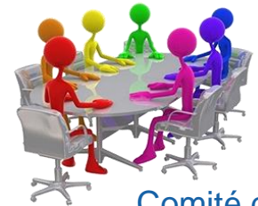
Comité de Investigaciones