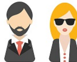
Directores de Programa